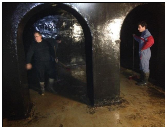
Intérieur de la chambre d'eau

Ces travaux ont été réalisés le 17 mai 2014.